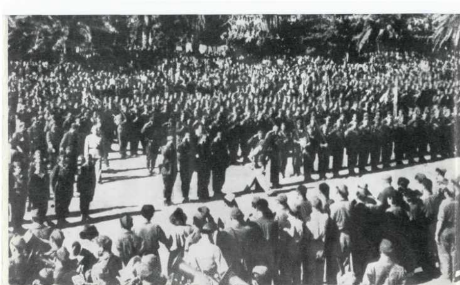
Maršal Tito dolazi na smotru jedinica 1 Dalmatinske udarne brigade na Visu 12. septembra 1944.