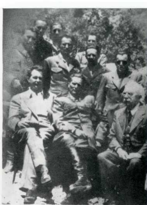
Maršal Tito sa članovima NKOJ-a i dr Subašićem, Vis juni 1944.

Fotokopija završnog dijela sporazuma Tito—Subašić