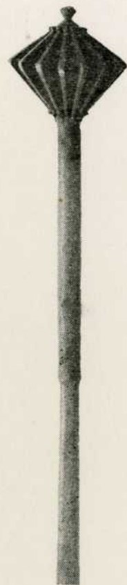
Buzdovan perni, 16. st., (2817)