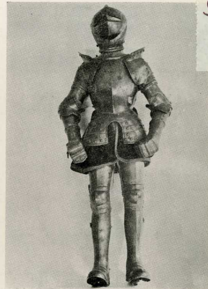
Model oklopnika, 16. st., (2868)